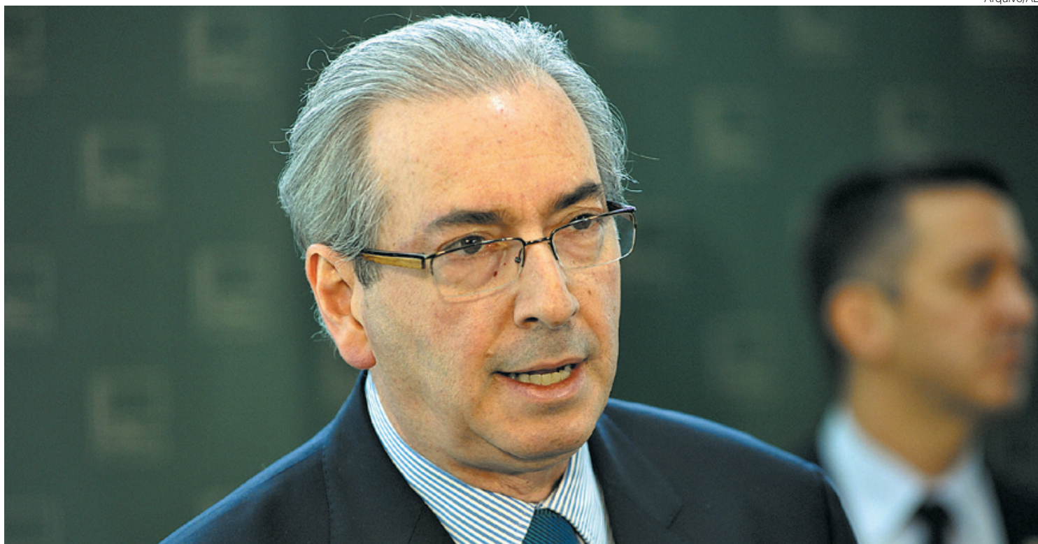
Mesmo com a decisão, ex-presidente da Câmara continua com seu passaporte seguirá retido