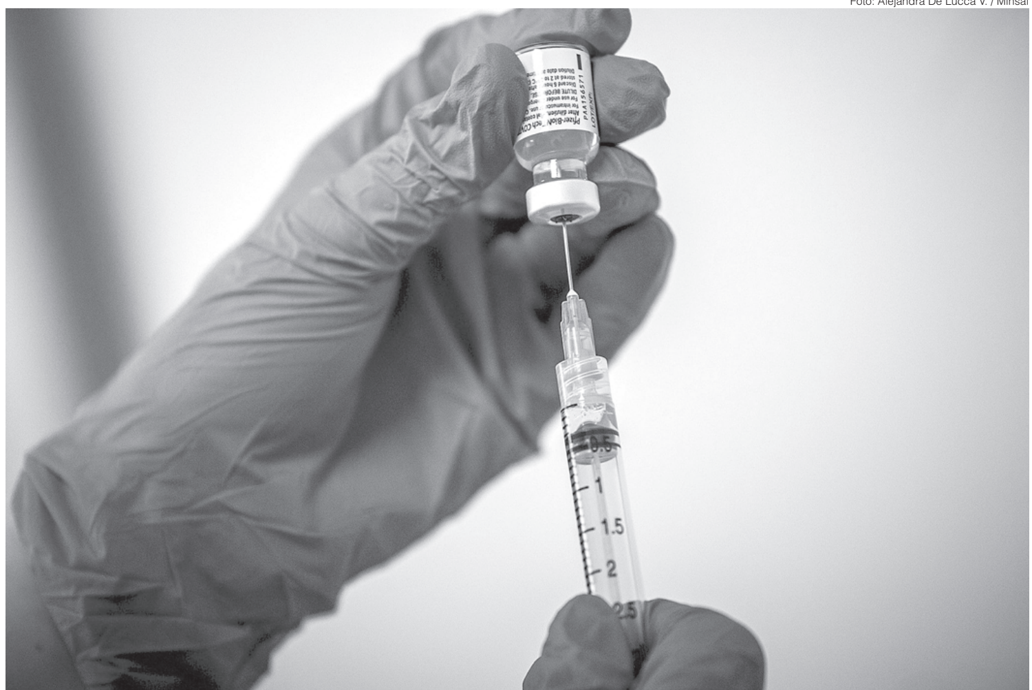
No total, 1 milhão de doses serão transportadas em voo que chegará ao Aeroporto de Viracopos