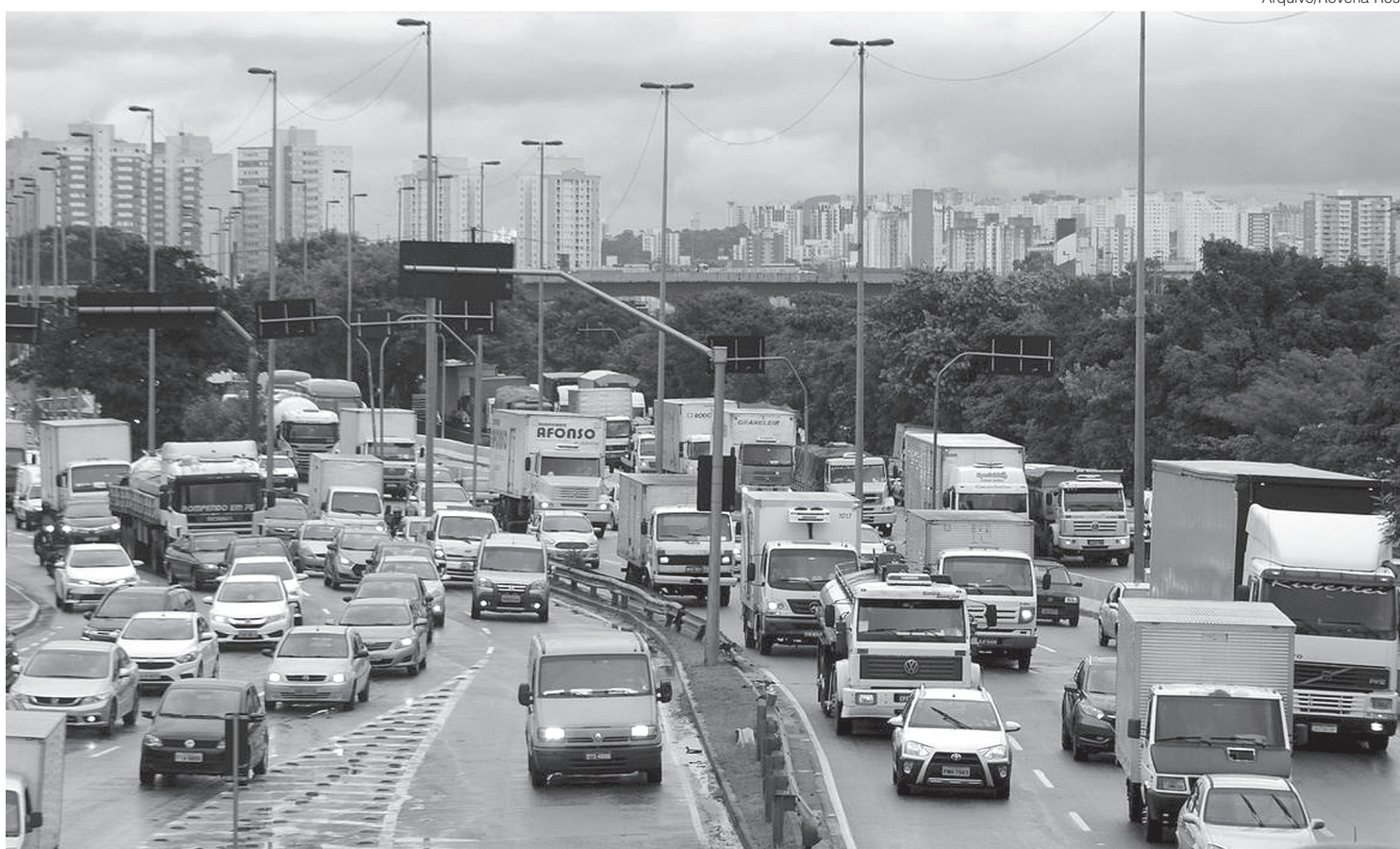
Condutores das categorias C, D ou E flagrados sem exame toxicológico periódico, de acordo com a tabela, ficarão sujeitos a aplicação da multa

O Contran determinou ainda que os laboratórios credenciados em todo o país deverão inserir no sistema Renach a informação, em até 24 horas, da data e hora da realização da coleta do exame. Além disso, os laboratórios terão um prazo de até 25 dias, contados a partir da data da coleta, para incluir o resultado do