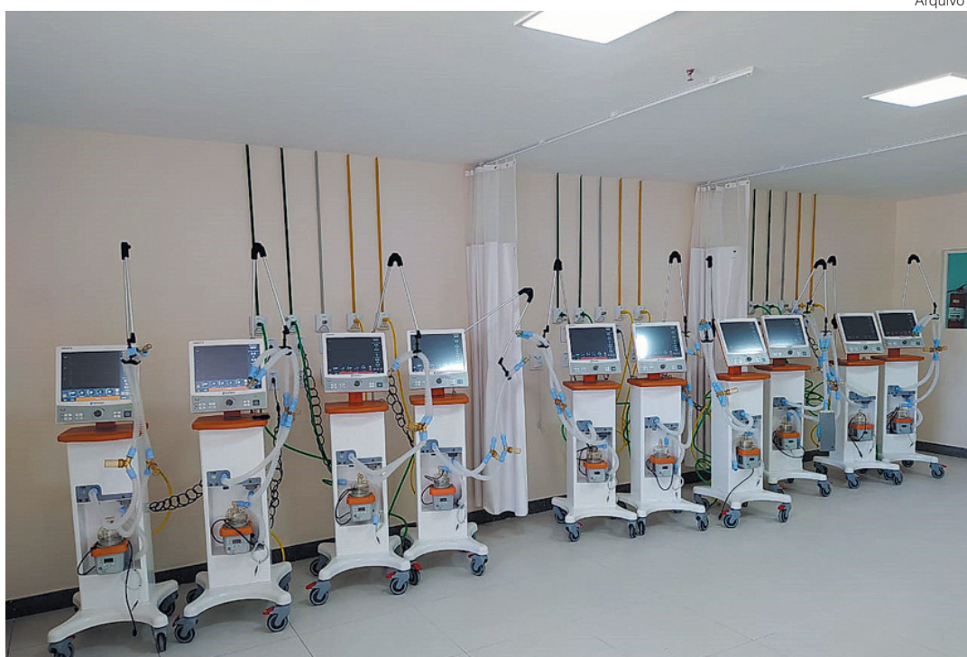
Respiradores destinados ao Hospital do Retiro estavam com problemas e tiveram que ser devolvidos